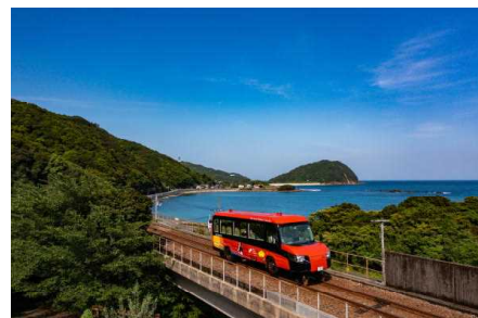
デュアル・モード・ビークル