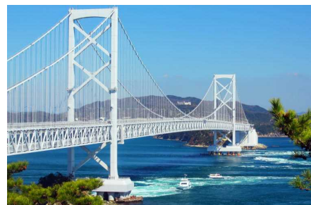
鳴門の渦潮・大鳴門橋